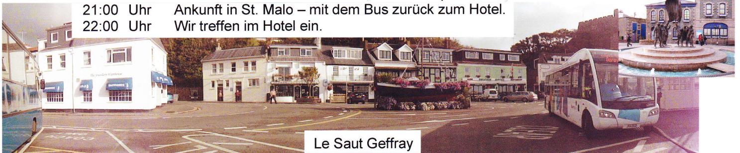
Le Saut Geffray